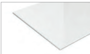
alternative Glasfarbe weiß

* C-Filter muss über Schranktür zugänglich sein, bitte im Ausblas vorsehen!